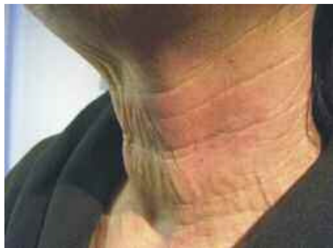
Abb. 6: Patientin mit Falten im Halsbereich

Wir führen die Radiofrequenz-Therapie in unserem Institut seit 17 Monaten durch. Bisher haben wir mehr als 100 Behandlungen des Gesichtes, des Halses und des Dekolletés mit sehr gutem Erfolg und