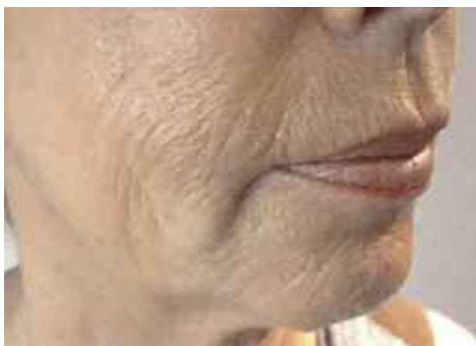
Abb. 8: Patientin mit Wangen und Lippenfalten vor der Behandlung