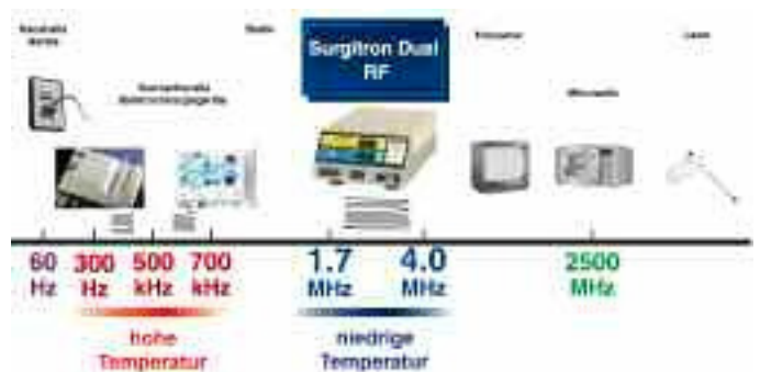
Abb. 3: Frequenztabelle

Die besten Ergebnisse werden im Gesicht und am Hals erzielt. Kleine Fältchen am Unterlid und Falten am Hals sind eine Domäne der Radiage™ [6, 14]. Diese Areale können mit anderen Therapien meist nur ungenügend erfolgreich behandelt werden. Die Behandlung eignet sich auch hervorragend um hängende Wangen zu straffen. Die Therapie kann aber auch an anderen Bereichen des Körpers, wie zum Beispiel am Bauch oder den Beinen eingesetzt werden.