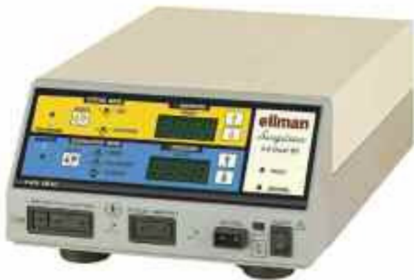
Abb. 1: Surgitron 4,0 Dual RF der Firma Ellman

Die Radiofrequenztherapie hingegen nutzt die physikalische Eigenschaft von Radiowellen die Energie und somit Hitze am Ort des höch-