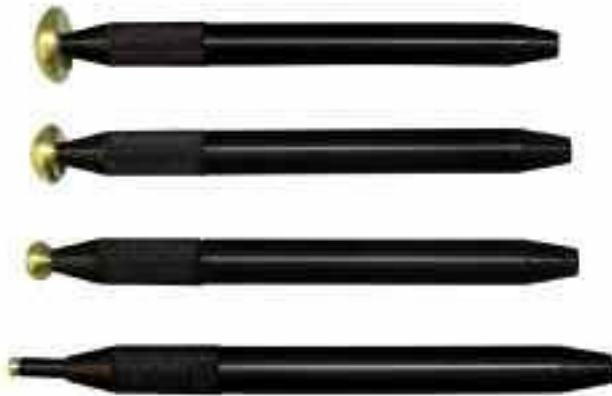
Abb. 5: verschiedene Dome Handstücke

Nach der Behandlung ist keine Abheilungsphase, wie es nach invasiven kosmetischen Operationen notwendig ist, abzuwarten. Es kommt zu leichten Rötungen, welche meistens kürzer als eine Stunde, nie länger als 1–2 Tage, sichtbar sind. Alle normalen Aktivitäten können sofort nach der Behandlung wieder aufgenommen werden. Die Sonneneinstrahlung muss nach der Therapie nicht gemieden werden. Es kommt zu keinen Pigmentirritationen. Dieses stellt wiederum einen deutlichen Vorteil zu invasiveren Therapieformen dar. Es sollten 2–3 Behandlungen im Abstand von jeweils 3–4 Wochen [10] erfolgen. Der volle Effekt entwickelt sich bis über einige Monate nach der Behandlung und hält dann variierend vom Ausgangsbefund zwischen ein bis drei Jahre an. Wie bei nahezu allen ästhetischen Anwendungen verschwindet der Effekt langsam. Es können jedoch zu jeder Zeit weitere Behandlungen nach belieben erfolgen. Die Abbildungen 6–9 zeigen Behandlungsbeispiele.