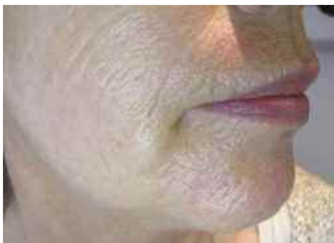
Abb. 9: gleiche Patientin nach 2 Radiesse™ Behandlungen